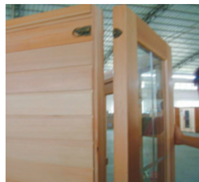
Verbinden des Front-Elements

10. Geben Sie alle Kabel außerhalb der Kabine, damit Sie Platz haben um das Decken-Element einzulegen. Öffnen Sie die Tür, heben Sie das Decken-Element leicht an um die Kabel durch die dafür vorgesehenen Bohrungen am Deckenelement zu stecken. Verbinden Sie die Stecker mit der Steuereinheit am Deckenelement. Danach verschrauben Sie das Deckenelement jeweils an einer Seite mit den Wänden.