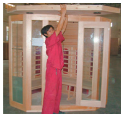
Montage der Decke

10. Geben Sie alle Kabel außerhalb der Kabine, damit Sie Platz haben um das Decken-Element einzulegen. Öffnen Sie die Tür, heben Sie das Decken-Element leicht an um die Kabel durch die dafür vorgesehenen Bohrungen am Deckenelement zu stecken. Verbinden Sie die Stecker mit der Steuereinheit am Deckenelement. Danach verschrauben Sie das Deckenelement jeweils an einer Seite mit den Wänden.