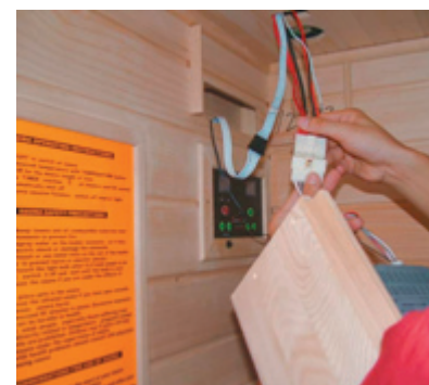
Verkabeln des CD-Radios

12. Die Verkabelung des Decken-Elements muss mit den Verbindungen der Kontrollpaneele, des CD-Radios, des Temperatursensors und der Radioantenne verbunden werden. Sollte eine dieser Verbindungen nicht vernetzt sein, wird die Infrarot-Kabine nicht funktionieren.