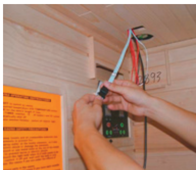
Verbindung zur Steuerung