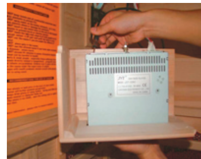
Verkabelung der Antenne

13. Befestigen Sie die Konsole mit dem eingebauten CD-Radio