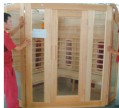
Befestigen des Front-Elements

9. Richten Sie die zusammengehörenden Front-Elemente mit der Bodenrahmung ein und vergewissern Sie sich, dass die linke Seite der Front-Platte exakt in die Nut auf der rechten Seite des linken Front-Elements einrastet